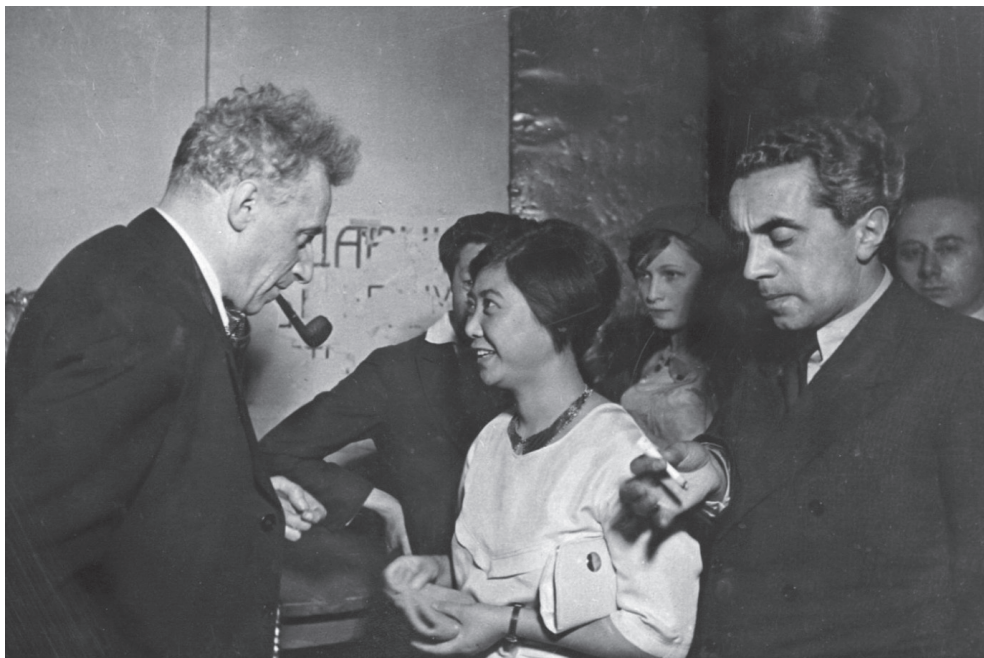
Фото 5. В. Э. Мейерхольд беседует с китайской писательницей Чу-Ланг-Чи и немецким драматургом Эрнстом Толлером на закрытии 2-го ежегодного Московского международного театрального фестиваля. Фото 10 сентября 1934 г., Москва. Библиотека Хоутона, Гарвардский университет, Кембридж, США: MS Thr 402 (Box 20: 836, sheet 45), коллекция Генри Уодсворта Лонгфелло Дейны / Vsevolod Meyerhold talks with the Chinese writer Chu-Lang-Chi and the German playwright Ernst Toller at the closing of the 2nd annual Moscow International Theatre Festival. Photo of 10 September 1934, Moscow: MS Thr 402 (Box 20: 836, sheet 45), Henry Wadsworth Longfellow Dana papers on Soviet theatre and film and university lecture notes, Houghton Library, Harvard University

Конструктивное налаживание культурных отношений между двумя странами в межвоенный период продолжалось, и этому во многом содействовал в том числе американский импресарио без приставки «полу-» Сидни Росс.