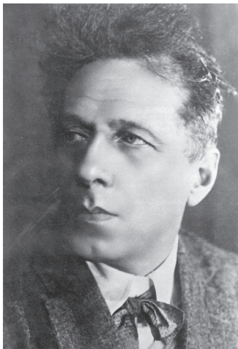
Фото 2. В. Э. Мейерхольд. Фото 1934 г., Москва. Библиотека Хоутона, Гарвардский университет, Кембридж, США: MS Thr 402 (Box 20: 836, sheet 43), коллекция Генри Уодсворта Лонгфелло Дейны / Vsevolod Meyerhold. Photo of 1934, Moscow: MS Thr 402 (Box 20: 836, sheet 43), Henry Wadsworth Longfellow Dana papers on Soviet theatre and film and university lecture notes, Houghton Library, Harvard University

точился на сотрудничестве с Мейерхольдом (фото 2). Руководитель ГосТИМа в это время тоже уже находился в Париже: «Не позднее 15 мая (1930 года) Мейерхольд и Райх приехали во французскую столицу, оставив труппу в Германии» [15, с. 762]; «Дата установлена косвенно. На 15 мая у Мейерхольда была назначена встреча с Ф. Жемье по поводу виз (РГАЛИ. Ф. 998. оп. 1. ед. хр. 2822. Л. 9)» [15, с. 805]. Интересы советского режиссера и американского импресарио совпали. Мейерхольду поездка ГосТИМа в США виделась спасением в той кри-