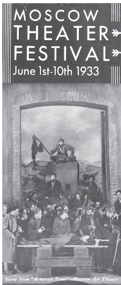
Фото 4. Обложка программки 1-го ежегодного Московского международного театрального фестиваля. 1–10 июня 1933 г. Библиотека Хоутона, Гарвардский университет, Кембридж, США: MS Thr 402 (Box 40: 1390, sheet 1), коллекция Генри Уодсворта Лонгфелло Дейны / Cover of the program for the 1st annual Moscow International Theatre Festival. June 1–10, 1933: MS Thr 402 (Box 40: 1390, sheet 1), Henry Wadsworth Longfellow Dana papers on Soviet theatre and film and university lecture notes, Houghton Library, Harvard University